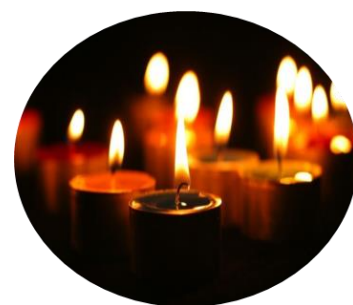
Une pensée pour les 3 habitants qui nous ont quittés cette année ...