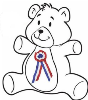
2 Baptêmes Civil

Toutefois, nous pouvons vous informer du nombre d'actes pour l'année 2022 :