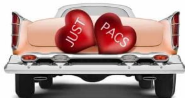
1 Pacs ...