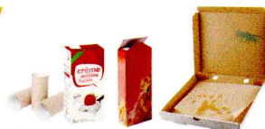
Emballages en carton